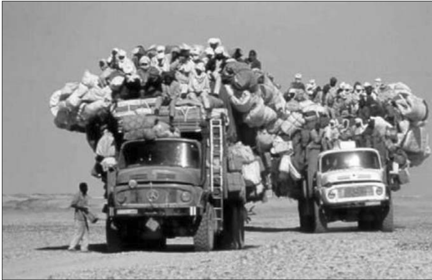
Foto. El acceso al crédito nos ha permitido aumentar nuestras formas de libertad. El acceso al crédito nos ha permitido aumentar nuestras formas de libertad en los países desarrollados. A la vez persisten terribles focos de pobreza que avergüenzan al género humano.

Por todo lo anterior vivimos una crisis profunda, tal vez la de mayor calado desde 1929. Esta crisis financiera relacionada con el mercado inmobiliario es, como ya dijimos en estas mismas páginas, una crisis mundial de confianza. Desde 1987 con la desregulación de las instituciones financieras, ha brotado una capacidad creativa tal que ha conseguido convertir los mayores simbolismos del