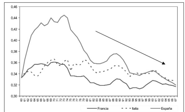
Gráfico 3. Productividad del capital. España vs. Francia e Italia. Fuente: Joan Ramón Rovira a partir de datos de Ameco. Los países basados en el derecho y en un marco regulatorio rígido muestran un descenso de productividad. Destaca el ascenso de productividad Española de los años 60 que coincide con la apertura económica de la época.