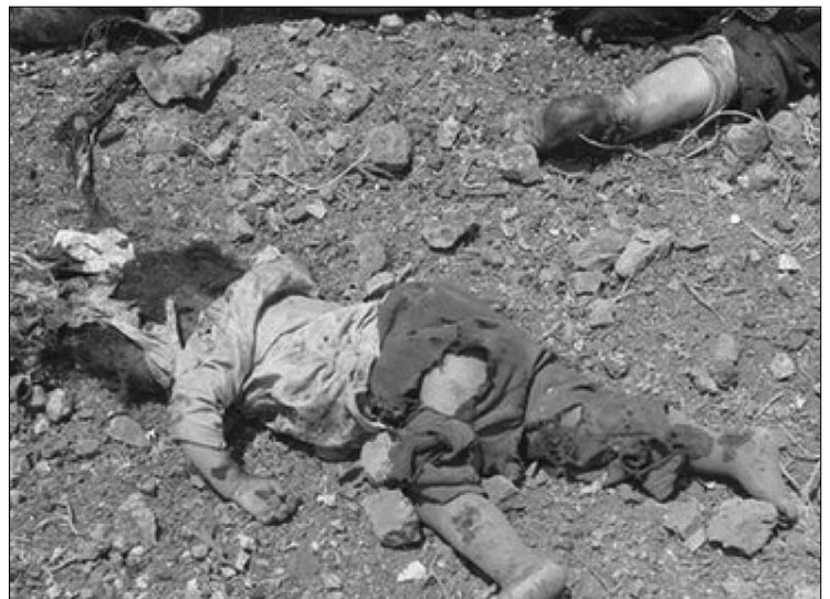
Foto 2- Los desastres de la guerra de 2008. No obviarlos, no omitirlos, no olvidarlos, no ocultarlos, no encubrirlos, no acallarlos.